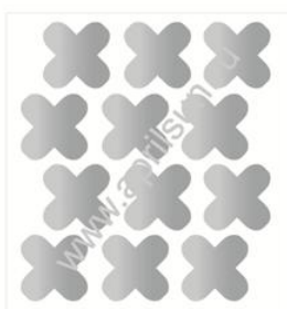
Набор термошевронов "Крестики"