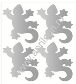
Набор термошевронов "Ящерицы"