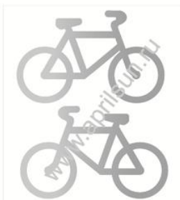
Набор термошевронов "Велосипеды"