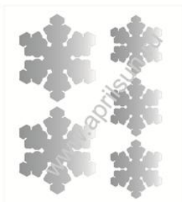
Набор термошевронов "Снежинки"