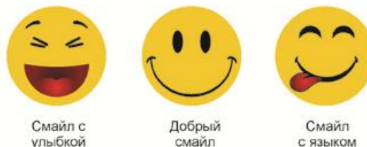
Смайл с улыбкой