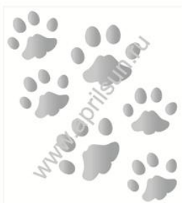
Набор термошевронов "Следы"

Светоотражающие термонаклейки на одежду. Наборы большие. 10x9 см и 9x9 см.