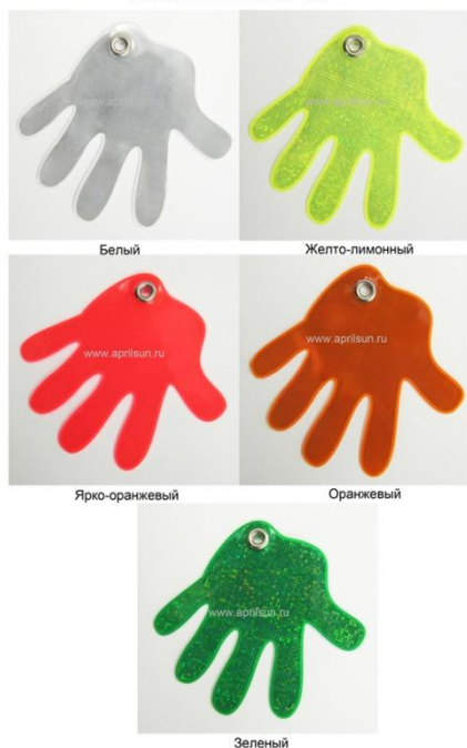
ПВХ подвеска «Ладوشка»

Такая подвеска не бьется, порвать ее очень трудно, края сварены таким образом, что раскрыться они не могут.